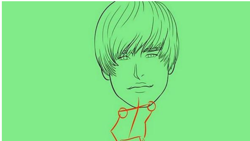
Cursos en Internet: Cómo dibujar a Justin Bieber.

Recibe 40 millones de visitas por mes Desde "cómo patear un penal" hasta "cómo ser comunista", el sitio WikiHow ofrece todo tipo de tutoriales. La misma gente los va subiendo.